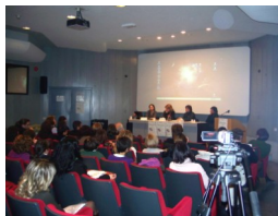
Un momento dei lavori

La giornata del sabato ha visto anche le testimonianze dirette di alcuni studenti del Leopardi Majorana i quali hanno riportato i loro vissuti e esperienze, nonché la proiezione di filmati che hanno mostrato modalità di lavoro e intervento sul campo.