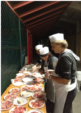
Il manifesto e alcune foto dell'evento

Grazie al contributo del Comune di Fidenza, venerdì 7 dicembre ore 21.00 presso il Teatro "G.Magnani" di Fidenza la Fondazione organizzerà l'annuale spettacolo benefico natalizio dal Titolo: