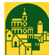
Il Governatore e le altre autorità in visita a Marzo 2012 Lo stabile a Giugno 2012 Il logo di progetto

Il 29 Ottobre — L'impresa costruttrice ha consegnato alla Fondazione l'edificio. Nel mese di Novembre sarà così possibile arredare all'interno e all'esterno la struttura. La struttura verrà poi completata con tutti gli accorgimenti e strutturazioni visive che permetteranno agli utenti di muoversi con disinvoltura e agio nella nuova sede. Per altro l'edificio, che dal punto di vista residenziale dispone di 9 posti letto con bagno, non è stato costruito all'oscuro degli utenti ma gli stessi hanno più volte visitato il cantiere, hanno scelto i colori delle stanze e hanno realizzato i mosaici che ornano i bagni.