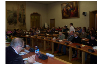
Presentazione del progetto Sala Consiliare Comune di Pordenone

Il 20 Ottobre 2010 abbiamo dato avvio al cantiere con la cerimonia della posa della prima pietra nel terreno di Via Roggiuzzole. L'attività di fund raising aveva fatto sì che si potesse avviare la costruzione dell'edificio. Avevamo infatti trovato degli importanti partner di progetto come la Fondazione CRUP che conosce e sostiene le attività della nostra Fondazione da anni, l' Associazione Enel Cuore ONLUS che ha deciso di finanziare parte del progetto viste le sue caratteristiche innovative e riproponibili in altre parti del Paese, la Banca FriulAdria Crédit Agricole , una banca attenta alle realtà del territorio, ma abbiamo anche trovato tanti sostenitori tra la gente che abbiamo raggiunto nelle molte iniziative che abbiamo preso per spiegare il progetto. Ci sono stati poi anche molti donatori tra coloro che hanno colto l'opportunità di elargire il 5x1000 dei propri tributi per la nostra realtà.