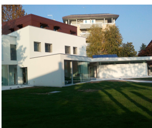
L'esterno della struttura a fine Ottobre

Infondazione è il foglio informativo mensile con cui la Fondazione Bambini e Autismo ONLUS vuole far conoscere all'esterno la propria attività e le proprie iniziative. Come potete avere infondazione