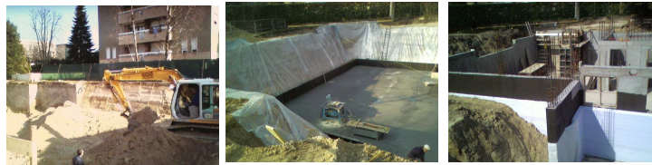
Le prime fasi di lavorazione e di avanzamento lavori

sibilità di far vedere ai potenziali donatori dove sarebbero andati a finire le risorse donate.