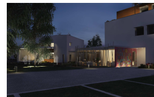
Render a computer del progetto

Il 20 Novembre 2009 nella Sala Consiliare del Comune di Pordenone è stato presentato ufficialmente il progetto alla città dopo che l'Amministrazione Comunale aveva deciso di mettere a disposizione della Fondazione un terreno di sua proprietà (diritto di superficie) per 99 anni in una zona centrale della città.