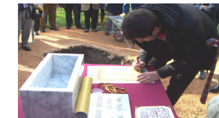
Cerimonia della Prima pietra