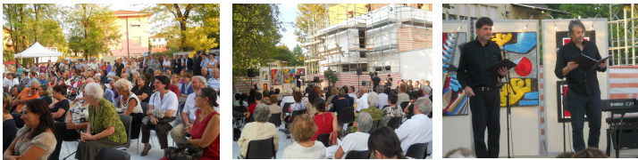
Momenti della festa del tetto e la costruzione al grezzo

Il 22 Settembre 2011 - abbiamo fatto la "festa del tetto" riproponendo una antica festa in uso nell'edilizia che consiste nel mettere "la frasca" sopra al tetto quando si raggiunge appunto quel traguardo ovvero il completamento della struttura al grezzo. Alla festa partecipò un numeroso pubblico, i partner di progetto e le autorità. La festa fu una occasione per incontrarsi con i donatori e per ringraziare i molti che con grandi e piccole risorse avevano reso possibile quel risultato. Come in tutte le feste vi fu un momento ludico, nel nostro caso uno spettacolo molto apprezzato dal pubblico in cui tutti gli artisti si esibirono gratuitamente a beneficio della Fondazione.