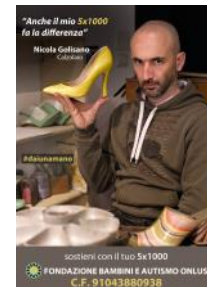
sostieni con il tuo 5x1000 FONDAZIONE BAMBINI e AUTISMO ONLUS C.F. 91043880938