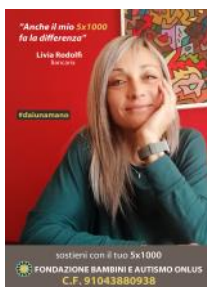
sostieni con il tuo 5x1000 FONDAZIONE BAMBINI e AUTISMO ONLUS C.F. 91043880938