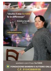
sostieni con il tuo 5x1000 FONDAZIONE BAMBINI e AUTISMO ONLUS C.F. 91043880938