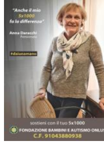
sostieni con il tuo 5x1000 FONDAZIONE BAMBINI e AUTISMO ONLUS C.F. 91043880938