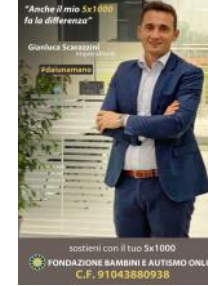
sostieni con il tuo 5x1000 FONDAZIONE BAMBINI e AUTISMO ONLUS C.F. 91043880938