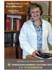
sostieni con il tuo 5x1000 FONDAZIONE BAMBINI e AUTISMO ONLUS C.F. 91043880938