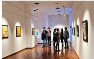
La mostra a Trieste

In questo clima anche Fondazione ha ricominciato a organizzare quegli avvenimenti che prima non si potevano tenere come ad es. le mostre.