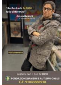
sostieni con il tuo 5x1000 FONDAZIONE BAMBINI e AUTISMO ONLUS C.F. 91043880938