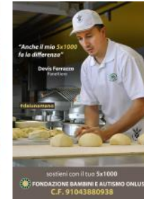
sostieni con il tuo 5x1000 FONDAZIONE BAMBINI e AUTISMO ONLUS C.F. 91043880938