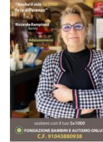
sostieni con il tuo 5x1000 FONDAZIONE BAMBINI e AUTISMO ONLUS C.F. 91043880938