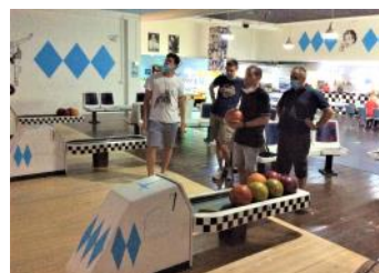
Immagine di una settimana vacanza 2019

Un altro segnale importante della ripartenza sono le attività estive che inizieranno questo mese in due