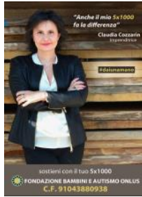
sostieni con il tuo 5x1000 FONDAZIONE BAMBINI e AUTISMO ONLUS C.F. 91043880938