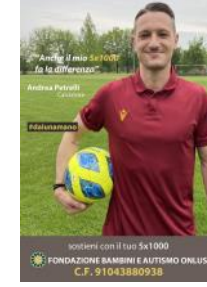
sostieni con il tuo 5x1000 FONDAZIONE BAMBINI e AUTISMO ONLUS C.F. 91043880938