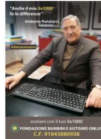
sostieni con il tuo 5x1000 FONDAZIONE BAMBINI e AUTISMO ONLUS C.F. 91043880938