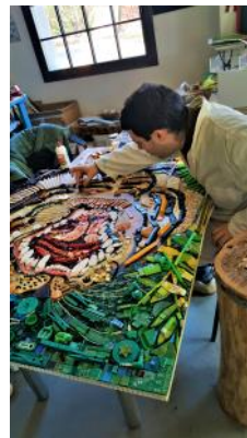
Un'opera in costruzione

La mostra è stata visitata oltre che dai triestini anche da molti turisti. Alcuni portati dalle navi da crociera che hanno ripreso a navigare e a fermarsi nel porto di Trieste, altri invece portati nella città dai primi "ponti" estivi. Ma mentre rimangono pochi giorni per visitare la mostra Triestina apre finalmente i