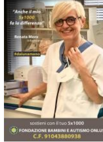
sostieni con il tuo 5x1000 FONDAZIONE BAMBINI e AUTISMO ONLUS C.F. 91043880938