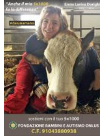
sostieni con il tuo 5x1000 FONDAZIONE BAMBINI e AUTISMO ONLUS C.F. 91043880938