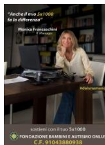
sostieni con il tuo 5x1000 FONDAZIONE BAMBINI e AUTISMO ONLUS C.F. 91043880938